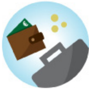
Werk en inkomen